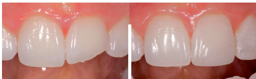
Stort stykke slået af