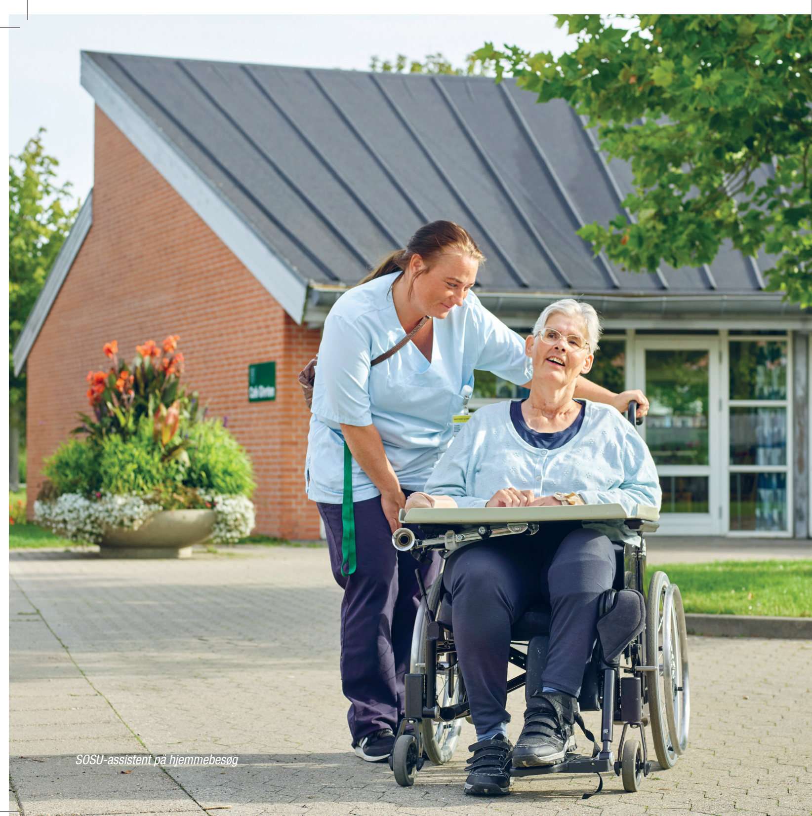
SOSU-assistent på hjemmebesøg