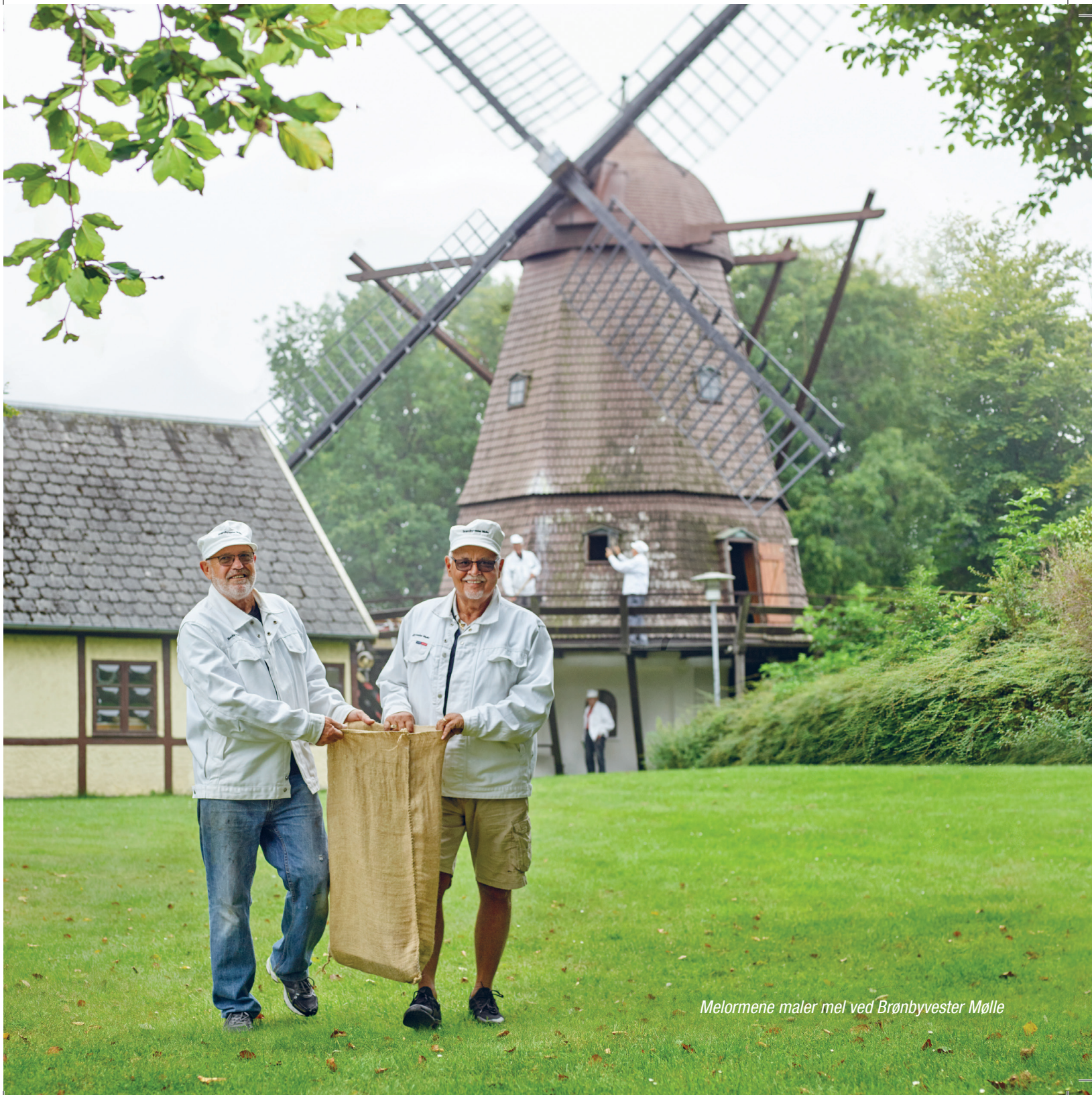
Melormene maler mel ved Brønbyvester Mølle