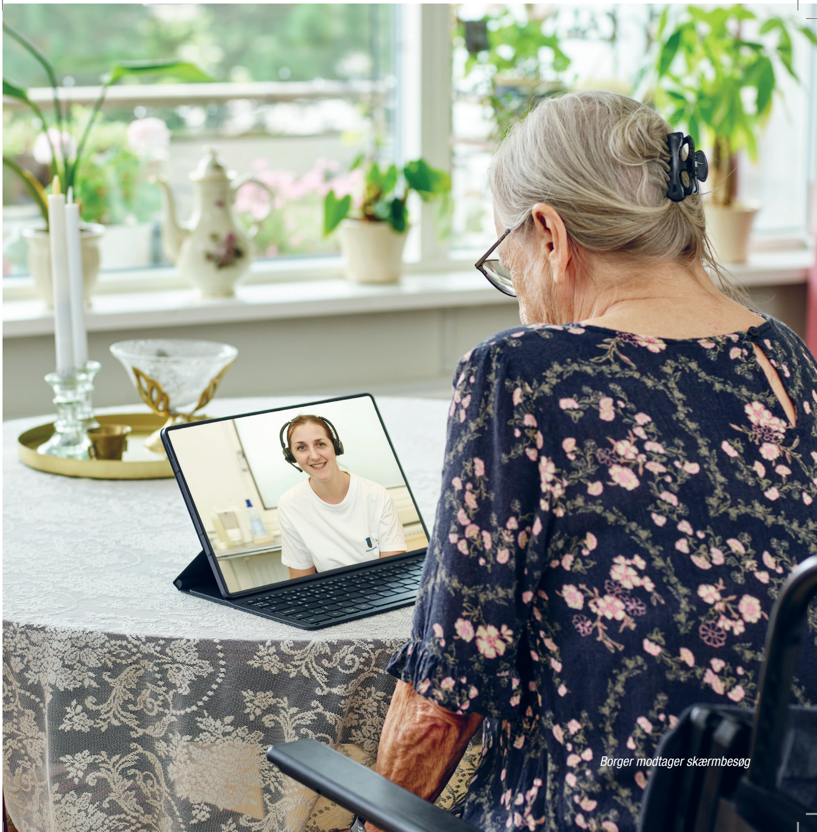
Borger modtager skærmbesøg