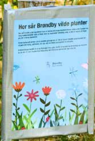
Vi lader græsset og vilde urter gro i Brøndby.