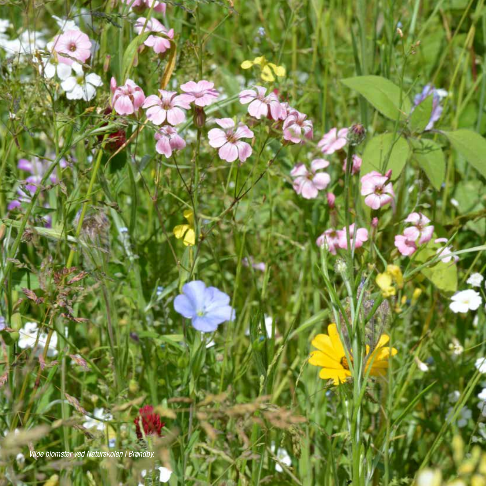
Vilde blomster ved Naturskolen i Brøndby.