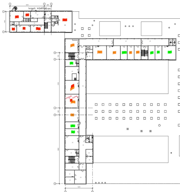
Figur 2 Udsugningsventilation i lokalerne på 1. sal.

Rød markering: ikke i drift, orange: svagt/naturligt træk, grøn: i drift