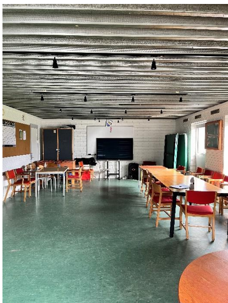
'Taktikrum' i Langbjerghallen

I 'Taktikrummet' fremstår vinduerne i dårlig stand. De udvendige glaslister er nedbrudt og flere steder slutter ruderne ikke tæt i rammerne. Enkelte steder sidder ruderne så løst, at man kan stikke en finger ind mellem rude og karm.