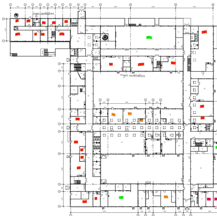
Figur 1 Udsugningsventilation i lokalerne i stueplan.

Under gennemgangen af ventilationsforholdene i lokalerne i stueetagen blev det generelt registreret, at den mekaniske ventilation enten ikke var i drift eller kun gav anledning til svag luftstrøm gennem udsugningsarmaturet (måske blot naturligt træk). I enkelte lokaler var den mekaniske udsugning tilsyneladende i normal drift. På Figur 1 er ventilationsforholdene i stueetagen markeret.