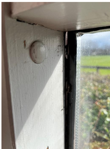
Sprække mellem rude og karm